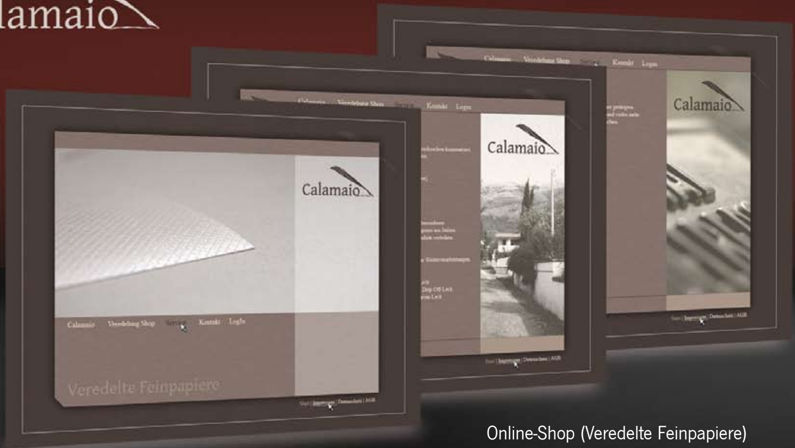
Online-Shop (Veredelte Feinpapiere)